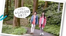
はるか昔から人々の信仰を集めてきた寺社や、生命力みなぎる大樹、歴史ロマンあふれるスポットを巡れば、大きなパワーがもらえます。ドライブも楽しいコースをご紹介します!