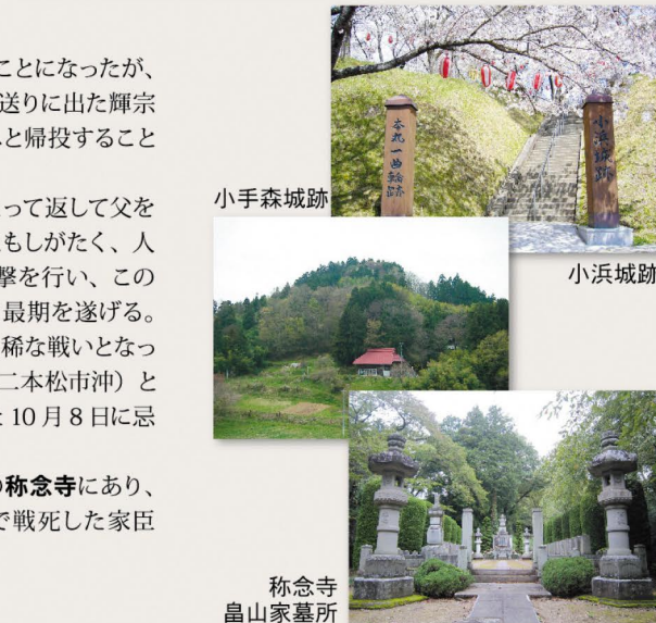
小手森城跡 小浜城跡 称念寺 畠山家墓所