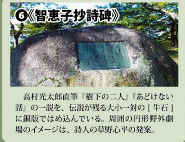
6《智恵子抄詩碑》 高村光太郎直筆『樹下の二人』『あどけない話』の一説を、伝説が残る大小一對の「牛石」に銅版ではめ込んでいる。周囲の円形野外地のイメージは、詩人の草野心平の発案。

日本百名城として多くの方が訪れる、梯郭式の平山城。現在は公園として整備され、園内には多くの見どころがある。特に天守台からの眺めは絶景。市内一円を見渡せる。平成19年国史跡指定