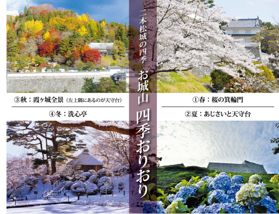
①春：桜の箕輪門 ②夏：あじさいと天守台 ③秋：霞ヶ城全景(左上隅にあるのが天守台) ④冬：洗心亭

二本松城は、阿武隈山系の裾野に位置する標高345mの白旗ヶ峰を中心として、三方が丘陵で囲まれた、馬蹄形城郭で、自然地形を巧みに活用した要塞堅固な名城であった。 15世紀中ごろ奥州探題・畠山氏の居城に始まり、一時伊達氏の支配ののち、会津領として蒲生・上杉・加藤氏らの城代時代が続いた。 寛永20年(1643年)、丹羽光重公が白河藩から二本松藩10万7000石の初代藩主として移封され、以後220有余年にわたり丹羽氏の居城となり、慶応4年の戊辰戦争を迎えることになる。 戊辰戦争では、旧幕府軍(東軍)の要衝として位置づけられ、隣藩会津への義に殉じて戦火に巻き込まれた。