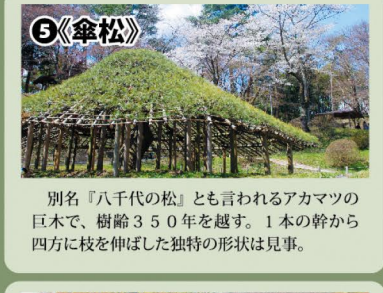
5《傘松》 別名「八千代の松」とも言われるアカマツの巨木で、樹齢350年を越す。1本の幹から四方に枝を伸ばした独特の形状は見事。