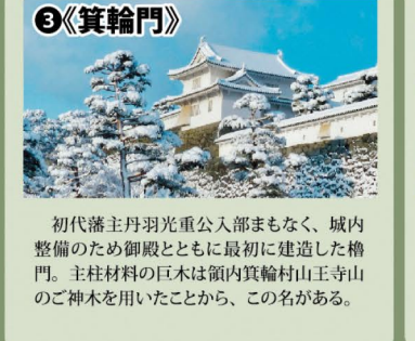
3《箕輪門》 初代藩主丹羽光重公入部まもなく、城内整備のため御殿とともに最初に建造した櫓門。支柱材料の巨木は領内箕輪村山王寺の大神木を用いたことから、この名がある。