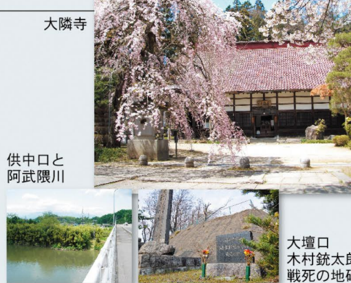
大隣寺 大壇口古戦場(写真右下)は、隊長・木村銃太郎、副隊長・二階堂衛守が率いた12〜17歳からなる二本松少年隊25名の奮戦地。尼子台を破った土佐の板垣退助率いる新政府軍本隊との攻防戦は、歴然とした戦力差のなかでの玉碎戦となった。新政府軍の指揮を執った野津七次(のちの元帥陸軍大将野津道貫)をして、「恐らく戊辰戦争中、第一の激戦であったろう」と言わしめた二本松城下の戦いの主戦場であった。

大壇口古戦場(写真右下) は、隊長・木村銃太郎、副隊長・二階堂衛守が率いた12〜17歳からなる二本松少年隊25名の奮戦地。尼子台を破った土佐の板垣退助率いる新政府軍本隊との攻防戦は、歴然とした戦力差のなかでの玉碎戦となった。新政府軍の指揮を執った野津七次(のちの元帥陸軍大将野津道貫)をして、「恐らく戊辰戦争中、第一の激戦であったろう」と言わしめた二本松城下の戦いの主戦場であった。 供中口古戦場(写真左下) は奥州街道を進む新政府軍本隊とは別に小浜方面から薩長兵を主力とする別働隊が進軍し、戦闘となった場所。阿武隈川を挟んで対峙した三浦権太夫義彰は、自ら天皇に刃向かう意思のないことを表すため、狩衣姿に鎌を外した弓矢を携え出陣し、敗色濃厚となると農兵を退却させ、ここで一人壮烈な自刃を遂げている。