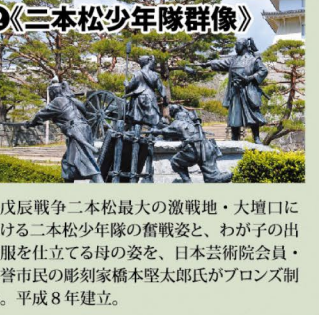
2《三本松少年隊群像》 戊辰戦争二本松最大の激戦地・大壇口における二本松少年隊の奮戦姿と、わが子の出陣服を仕立てる母の姿を、日本芸術院会員・名誉市民の彫刻家橋本聖太郎氏がブロンズ制作。平成8年建立。