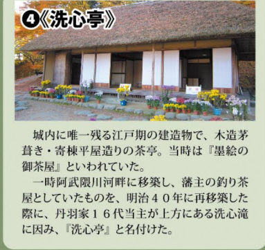
4《洗心亭》 城内に唯一残る江戸期の建造物で、木造茅葺き・寄棟平屋造りの茶亭。当時は『墨絵の御茶屋』といわれていた。一時阿武隈川河畔に移築し、藩主の釣り茶屋としていたものを、明治40年に再移築した際に、丹羽家16代当主が上方にある洗心堂に因み、『洗心亭』と名付けた。