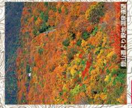
登山道より野地温泉周辺

注意 沼ノ平周辺と、くろがね小屋西斜面の湯立付近は、有毒な火山ガスが発生しているため非常に危険です。絶対に立ち入らないで下さい。 ● 立入禁止区域 — ルート閉止