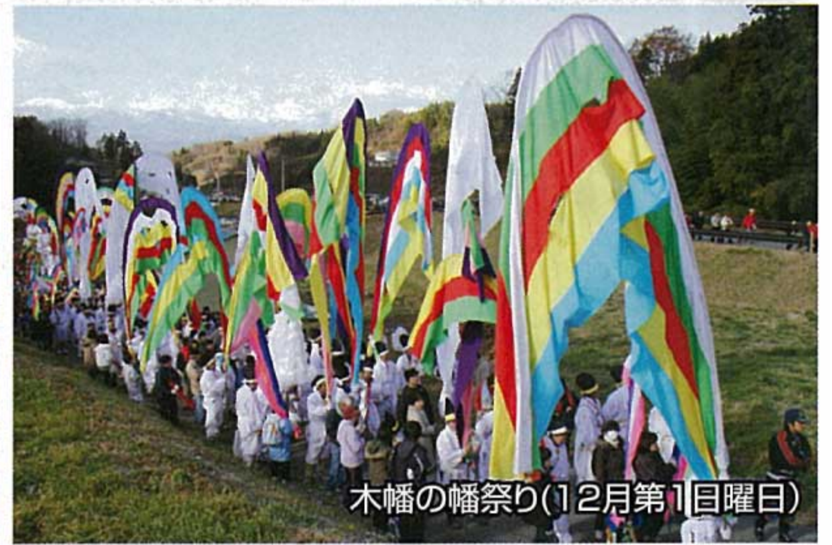
木幡の幡祭り(12月第1日曜日)