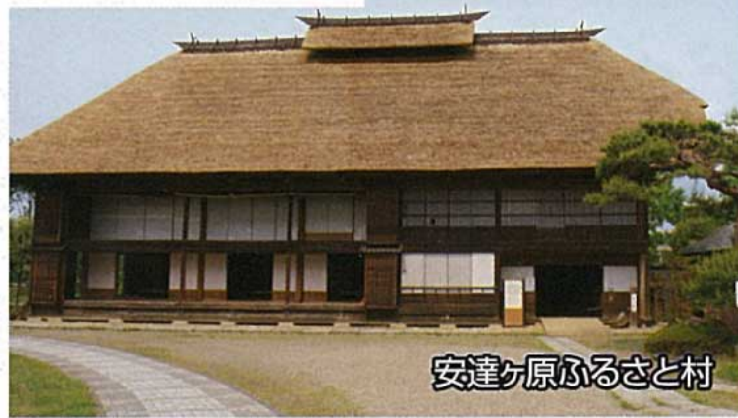
安達ヶ原ふるさと村