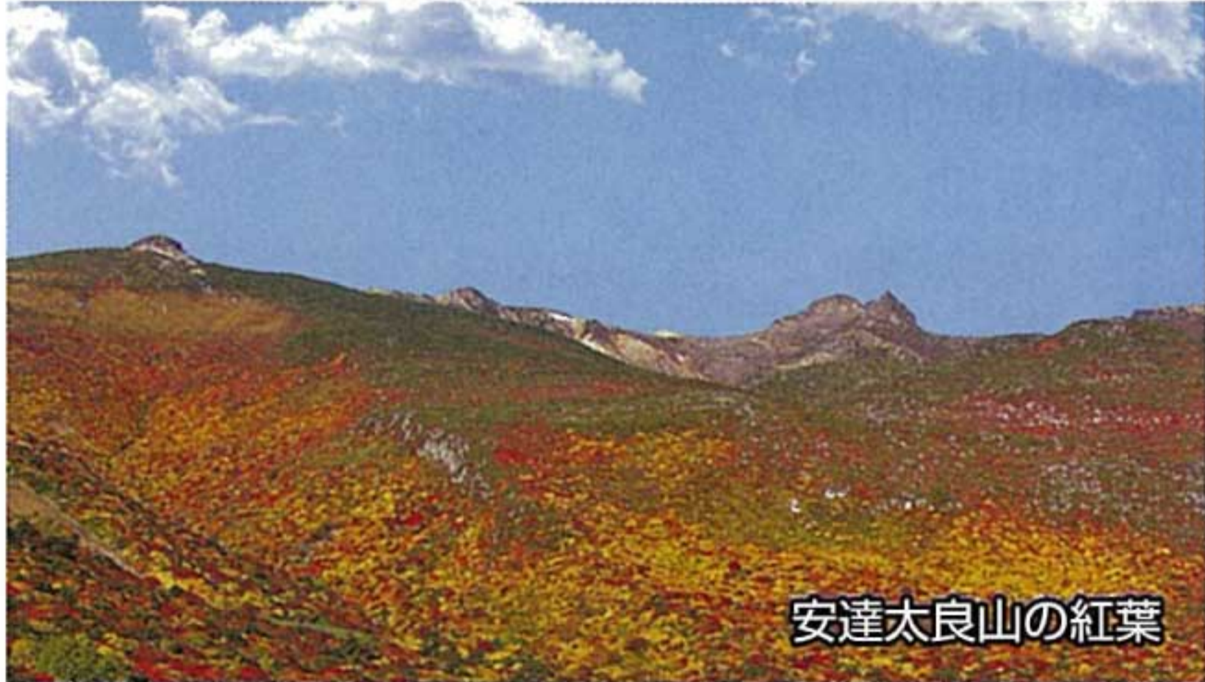
安達太良山の紅葉